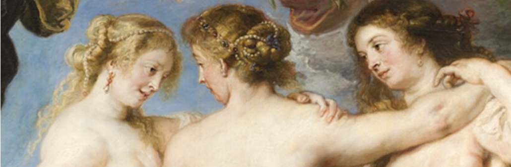
Las Tres Gracias de Rubens en el Museo del Prado, Madrid.

Posteriormente, en el siglo XVII, en tiempos del barroco, Pedro Pablo Rubens (1577-1640) les imprimió un matiz muy interesante mostrándolas como una celebración del cuerpo y de la vida material. La pintura ciertamente recuerda las esculturas clásicas pero las figuras expresan más bien una sensualidad corporal y vitalidad; son cuerpos voluptuosos con carne viva y piel luminosa y un contacto físico entre ellas. Ya no se trata de ideas abstractas sino de personajes reales que expresaban placer y abundancia vital representando la belleza y armonía en cuerpos con la belleza de la época. Más que los ideales del Renacimiento, la pintura quiere expresar un realismo humano.