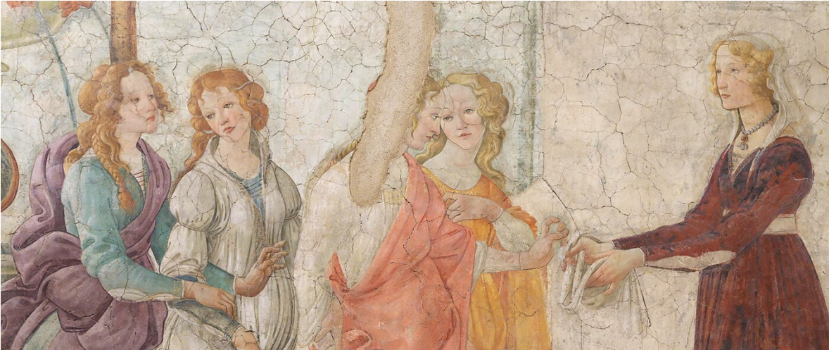
Venus y las tres Gracias ofreciendo sus dones. Botticelli (entre 1483 y 1486). Museo de Louvre, París.

El famoso pintor Rafael Sanzio (1483-1520) en el siglo XVI también las quiso mostrar con el estilo renacentista. Aparecen entrelazadas y forman un círculo que quiere simbolizar la unidad, equilibrio y armonía universal, como un ideal de belleza, cada una sosteniendo una manzana que alude a la belleza y al deseo de perfección como una visión optimista del ser humano. La búsqueda de esa armonía entre naturaleza y espíritu está inspirada precisamente en los ideales de la antigüedad de la Grecia antigua.