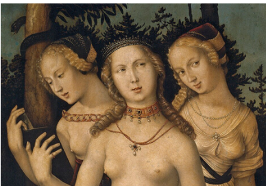
Las Tres Gracias de Baldung. Museo del Prado.

Y el pintor alemán Hans Baldung (1484-1545) también las quiso representar simbolizando la belleza, la armonía y la plenitud de la vida, pero con un matiz diferente de Italia. Se trata de una belleza frágil y transitoria donde lo bello está vinculado también con lo efímero porque el maravilloso cuerpo humano también se marchita. Sus Tres Gracias no son solamente la felicidad y la armonía porque también tienen una halo de misterio e incomodidad. De alguna forma, Baldung en la naciente Alemania las presenta con un tono más inquietante dentro del concepto de la armonía porque quiere mostrar una conciencia de lo efímero.