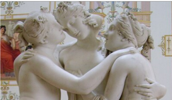
Las Tres Gracias de Canova en el Museo del Hermitage

Dos siglos después podemos admirar la escultura del italiano Antonio Canova (1757-1822) quien, en un período neoclásico, quiso volver a los ideales de la antigua Grecia esculpiendo las figuras de Orfeo, Teseo, Apolo, etc. Resalta en gran medida en ese contexto la dulzura de la escultura de Psiqué reanimada por el Beso del Amor . Sin embargo, en especial, sus Tres Gracias quieren reflejar el sentido espiritual y místico del Renacimiento en el período posterior del neoclasicismo.