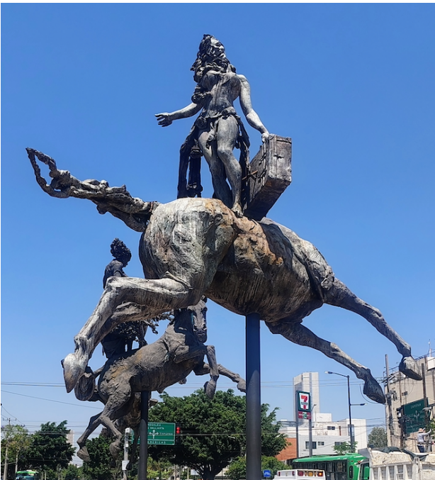
Las Tres Gracias de Garval, en la Plaza de la República, de Guadalajara, México.

Vamos a realizar una análisis del significado de las 3 esculturas llamadas “Las Tres Gracias”, producidas por el escultor Sergio Garval y ubicadas por el Ayuntamiento de Guadalajara, Jalisco, México, primero en la Av. Lázaro Cárdenas de esa ciudad y trasladadas posteriormente en 2026 a la Plaza de la República , en la confluencia de Av. de las Américas y Av. México. Creemos que es una excelente obra puesta bajo el dominio público para que estas esculturas puedan ser admiradas por transeúntes en vehículo y sobre todo por ciudadanos a pie en ese hermoso lugar ya remodelado.