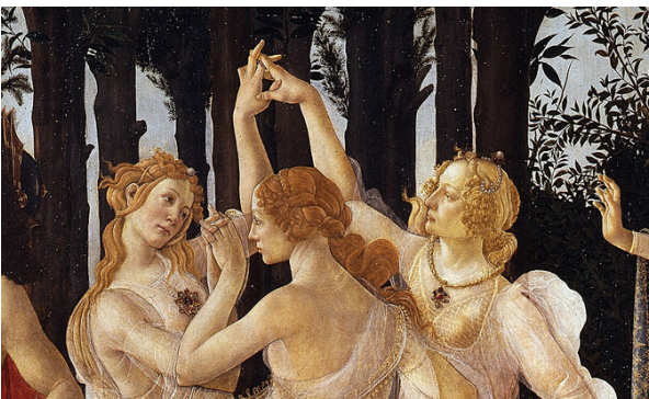
Las tres Gracias de Boticelli en su cuadro titulado La Primavera (alrededor de 1482), en Florencia.

Pero en esos inicios de la época del Renacimiento en la Europa del siglo XV sobresale la pintura de Sandro Boticelli (1445-1510) en su cuadro sobre La Primavera , donde las pintó simbolizando una elegancia ideal y espiritual mostrando sus cuerpos delgados, en una especie de danza con rostros serenos y movimientos suaves. Se trataba de expresar una belleza como ideal con armonía y orden. Era el momento en que Ficino había revitalizado el neoplatonismo en donde la belleza física podía ser símbolo de la belleza superior divina. Las tres gracias podían remitir a esa belleza superior, siendo símbolos de una perfección espiritual.