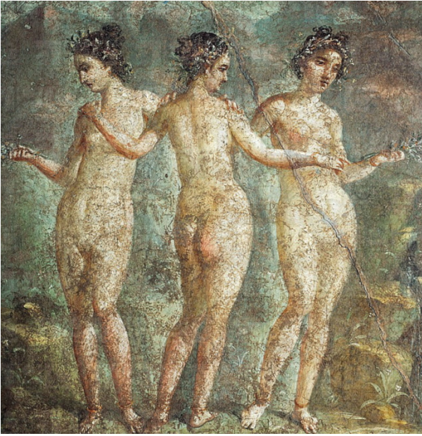
Así aparecen en las Tres Gracias, que son llamadas Carites (Χάριτες) en un fresco de la ciudad de Pompeya, en Italia, en el siglo I d.C. Archaeological Museum, de Nápoles.

El escritor italiano Giovanni Boccaccio (1313-1375), en su obra Genealogía deorum Gentilium del siglo IV d.C., las consideraba asistentes de Venus siempre buscando la armonía y la unión. Son hijas de Júpiter y símbolos de la sociabilidad humana. Sus cualidades (el dar, recibir y devolver) son elementos fundamentales para la convivencia humana porque su belleza no solamente es para admirar sino que fundamenta la amistad, la generosidad y el orden social. En este sentido, ellas no son solamente un obra decorativa para admiración sino que representan más bien una alegoría ética como valor moral.